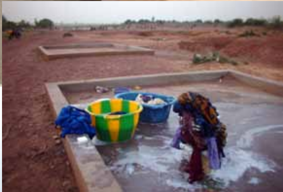
Organisation der Wasserentnahmestellen, hier Waschwasser